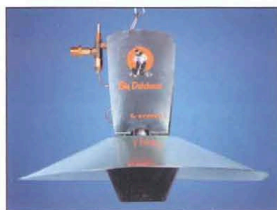
Рис. 5. Газовый излучатель SOL 11600

ливе (рис. 2). Его характеристики приведены в таблице 2.