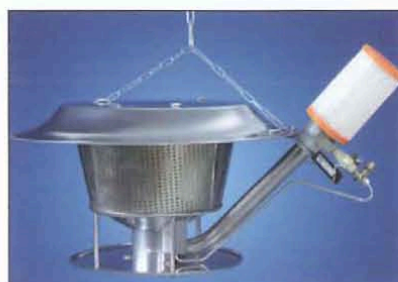
Рис. 4. Газовый излучатель G12